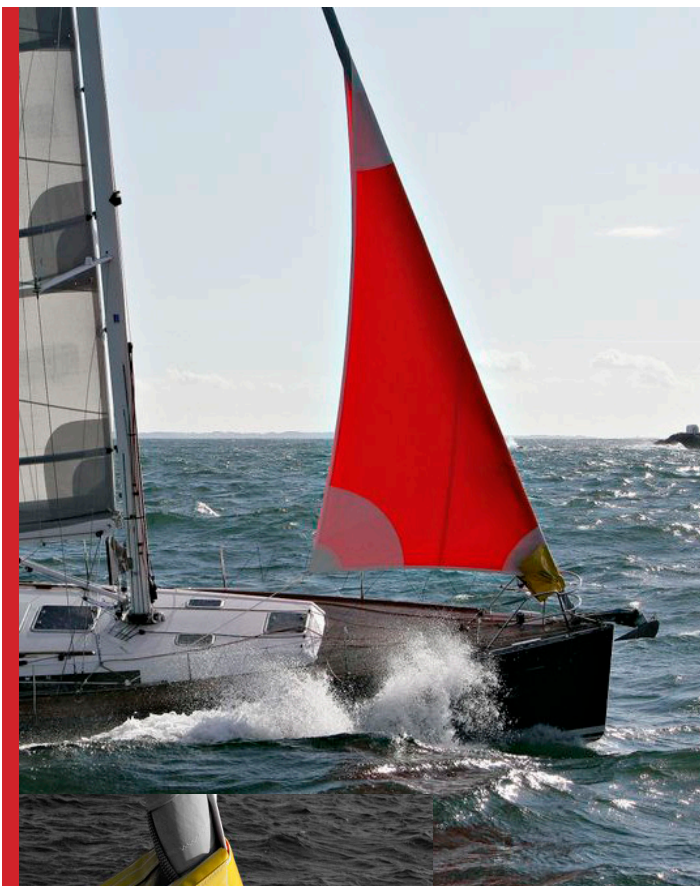
LE TOURMENTIN SPÉCIAL ENROULEUR